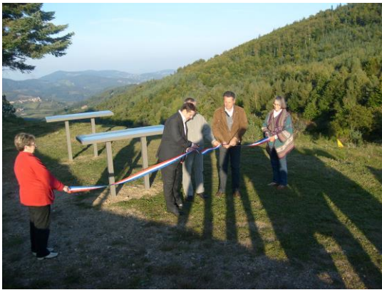
Table d'orientation du Col du Buisson

Vendredi 26 septembre a eu lieu l'inauguration des 2 tables d'orientation situées au Col du Buisson, projet initié sur le mandat précédent par Fabien Dumont. Un endroit idéal et stratégique, porte d'entrée de la commune pour découvrir un panorama magnifique de 180 degrés.